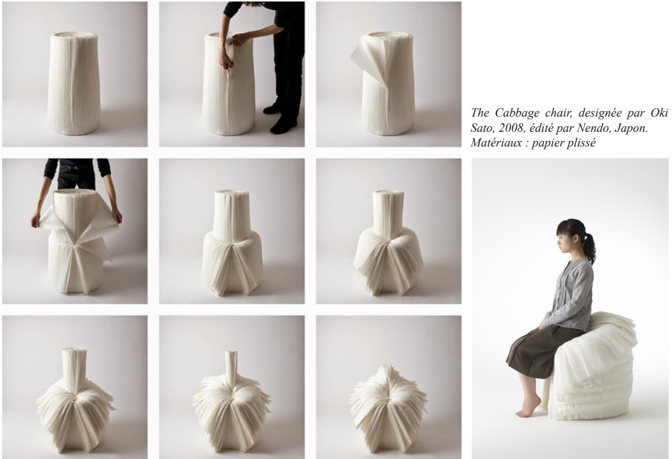
The Cabbage chair, conçue par Oki Sato, 2008, éditée par Nendo, Japon. Matériaux : papier plissé

Vous devez dans cette seconde partie effectuer une analyse de la Cabbage chair , créée par le designer Oki Sato en 2008. Nous porterons notre attention sur votre capacité à analyser l'objet et à en rendre compte graphiquement.